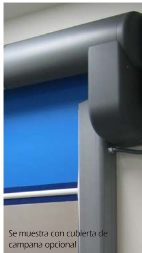
Se muestra con cubierta de campana opcional