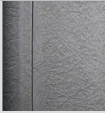
Columna lateral texturizada