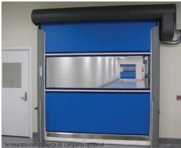
Se muestra con cubierta de campana opcional

Los materiales compuestos de fibra de vidrio ofrecen resistencia, larga vida y facilidad de limpieza. Plexline ofrece una estética alta y la durabilidad del acero inoxidable a un precio extraordinariamente bajo.