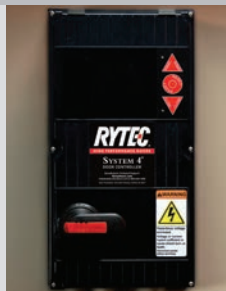
Se muestra el System 4 con desconexión giratoria opcional

Se muestran los tamaños máximos estándar; se ofrecen tamaños más grandes a petición en fábrica.