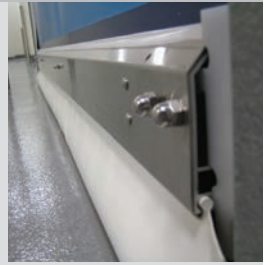
Barra inferior separable recubierta de acero inoxidable