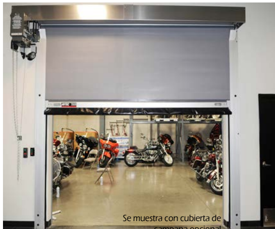
Se muestra con cubierta de campana opcional

La operación manual es estándar con un cabrestante, con una operación motorizada opcional disponible. El material del panel, cubiertas de rollo y puerta y borde reversible motorizado también son complementos opcionales.